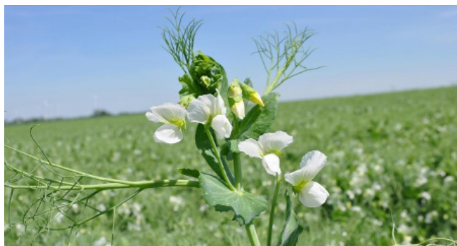
Erbse in der Blüte.