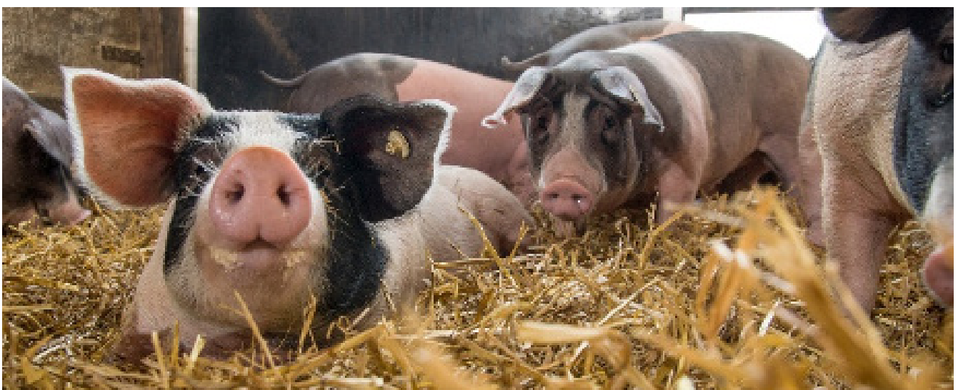
Schwäbisch Hällische Schweine auf Stroh.

hohe Rohprotein- und Energiegehalte. Unter Berücksichtigung der Einsatzempfehlungen für eine bedarfsgerechte Nährstoffversorgung von Schweinen, mit einer Analyse von Proteingehalten und Aminosäuremustern, ist ein Austausch des Sojas durch andere Körnerleguminosen in gewissem Umfang möglich. Jedoch müssen stets auch die betriebsinternen Gegebenheiten wie Anbaubedingungen, Lagermöglichkeiten und Fütterungstechnik betrachtet werden und vom Betriebsleiter in individuelle Entscheidungen miteinbezogen werden. Nur wenn alle Faktoren berücksichtigt werden, kann der Austausch von Soja gegen andere Eiweißkomponenten ein gewinnbringender Faktor werden.